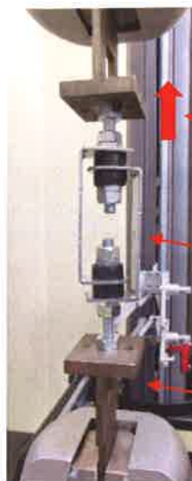
図 1-2 試験状況 (拡大)