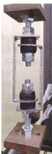
図 2-1 ① 負荷時