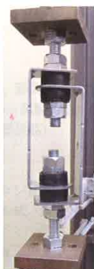
図 2-2 ① 除荷時