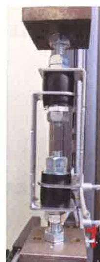
図 3-2 ② 除荷時