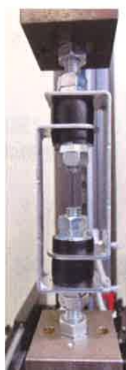
図 3-1 ② 負荷時