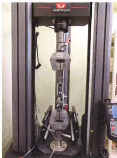
図 1 試験状況